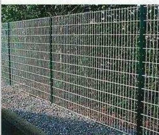
stub Axis 100/50 mm