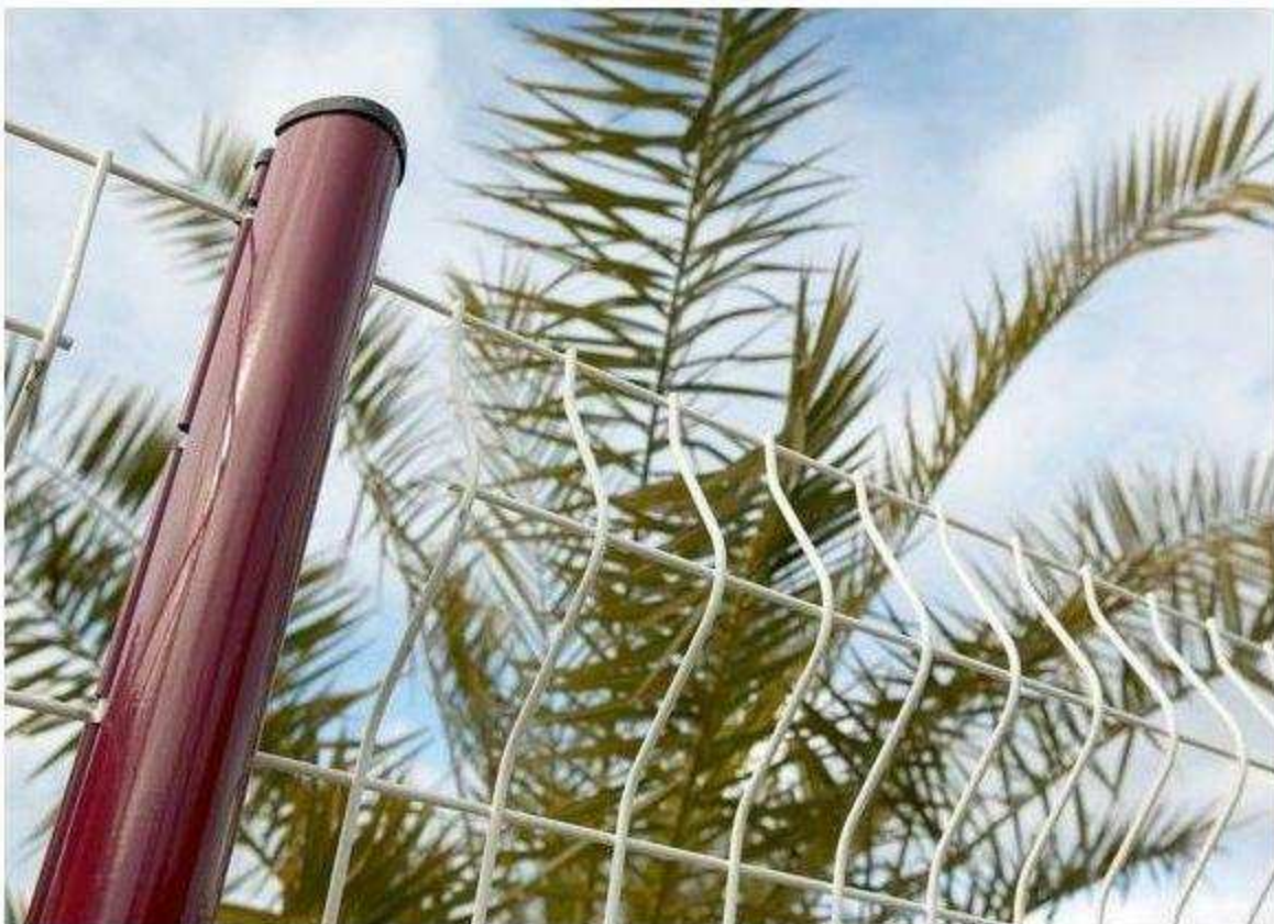
stub Axis 100/50 mm